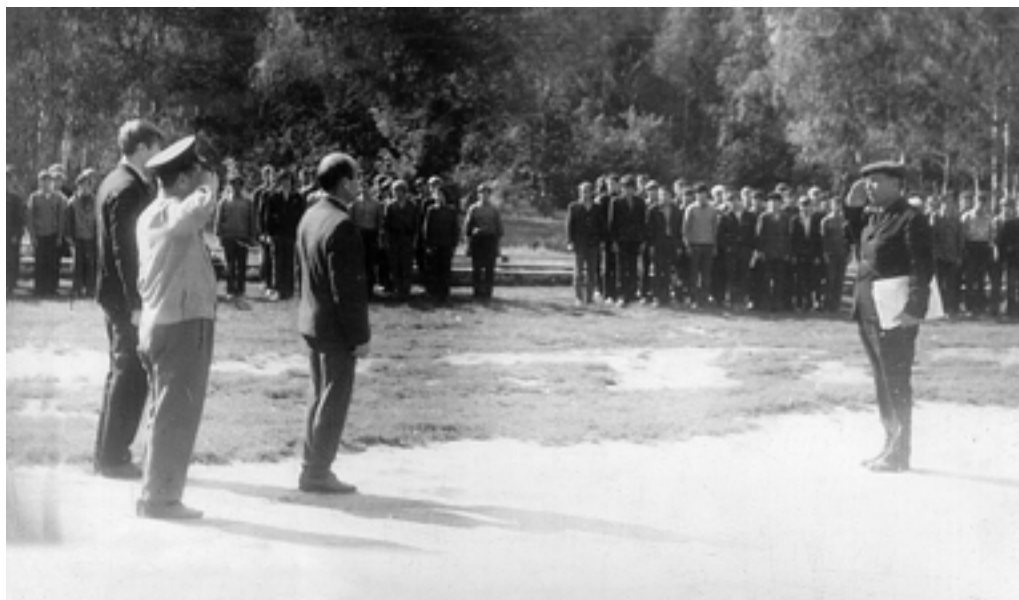
Лагерные сборы призывников КМЗ на базе пионерского лагеря имени Коли Мяготина.