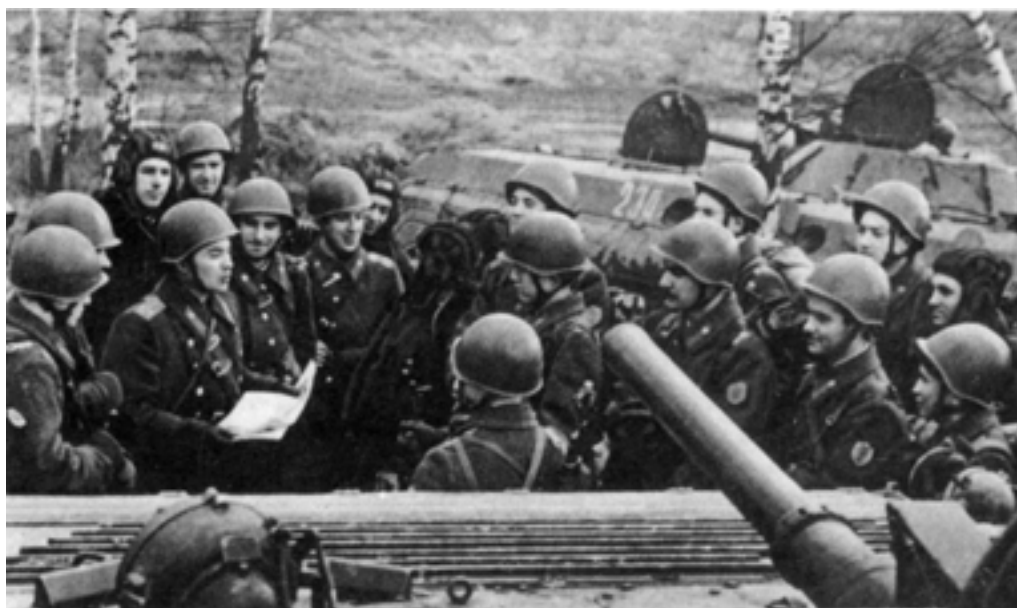
Родине – ратный труд воинов-уральцев