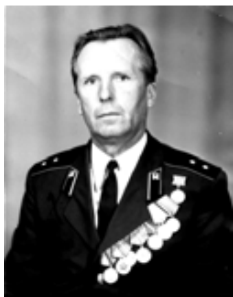
Могильный Василий Иванович