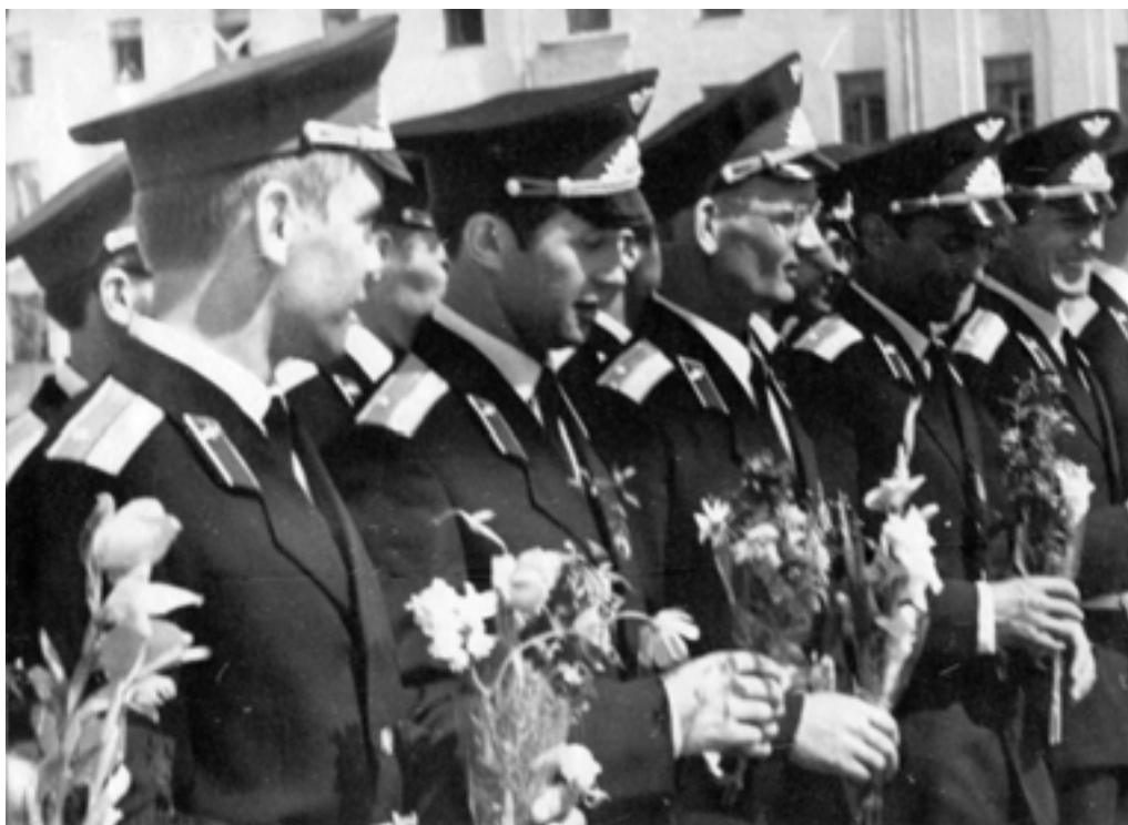
Первый выпуск лейтенантов. 1971 год

высшим образованием, подготовленный училищем, будет достойным пополнением частей Военно-Воздушных Сил”.