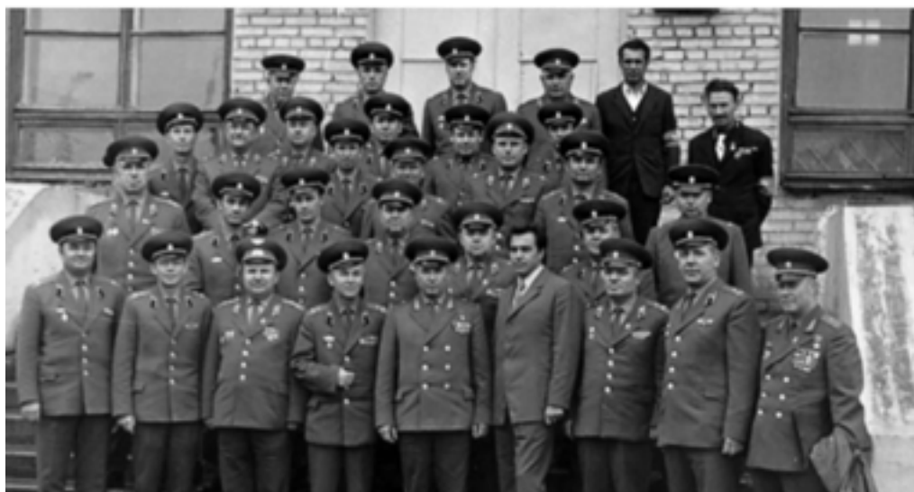
Мобилизационные сборы с руководящим составом округа. 1976 год

В 1976 году, на основании приказа Командующего УрВО, на базе Курганского областного военного комиссариата впервые проводились мобилизационные сборы с руководящим составом округа. Их целью являлось дальнейшее повышение боевой готовности органов военного управления региона в мирное время и отработка мероприятий в период объявления общей мобилизации в стране.