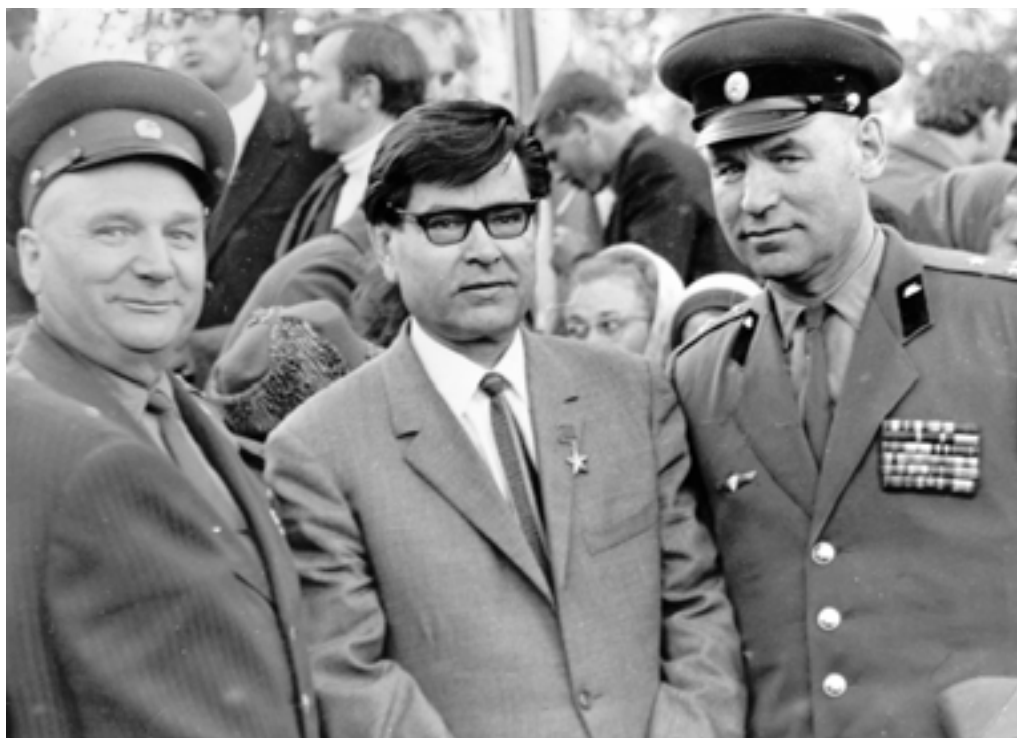
Дружеская встреча. 1971 год.