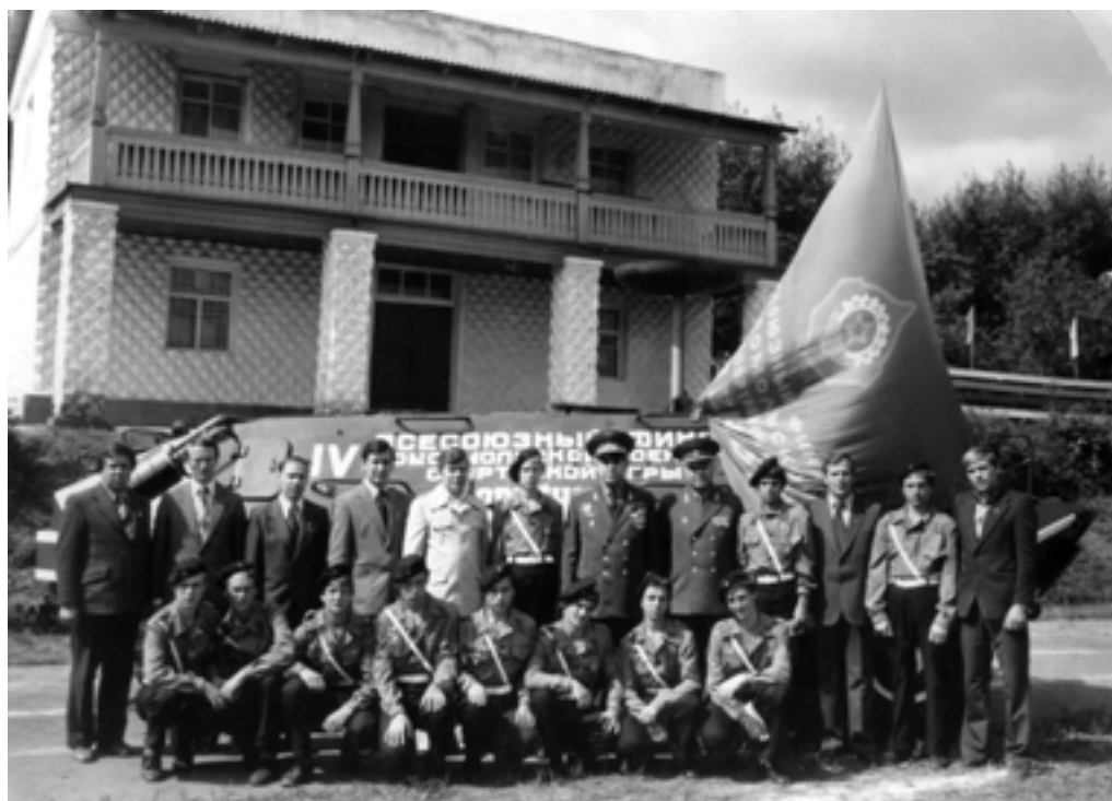
Курганская команда ГПТУ № 6 –

Совместно с военными комиссариатами большую работу по военно-патриотическому воспитанию молодежи проводила Курганская областная организация общества «Знание». Лекции, доклады и беседы, встречи с Героями Советского Со-