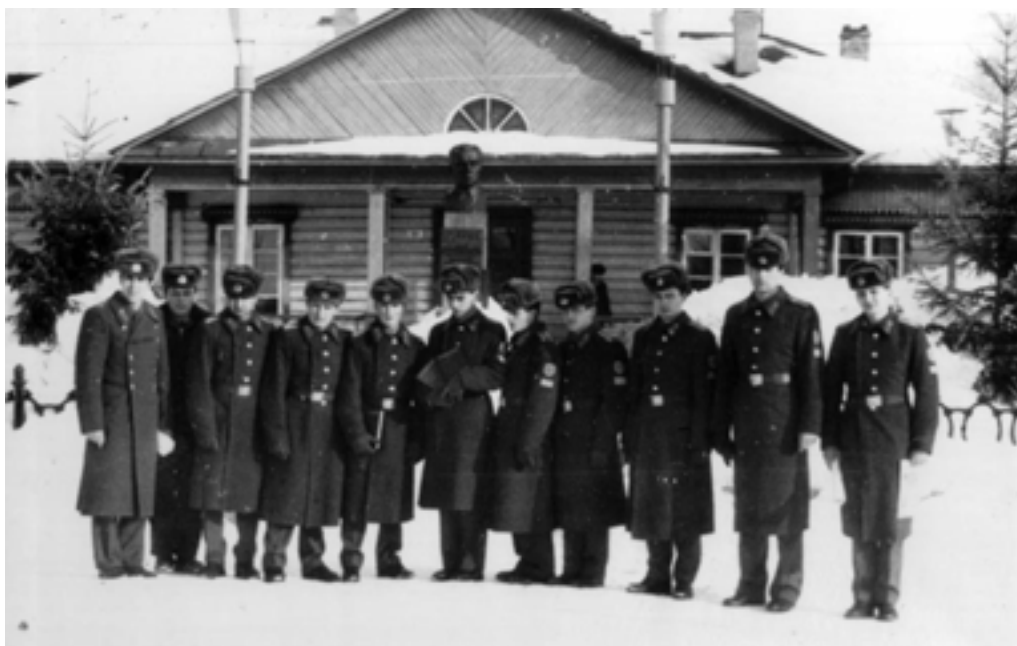
Курсанты в деревне Мальцево

Доброй традицией стало участие курсантов Курганского высшего военно-политического авиационного училища в агитпоходах по местам боевой и трудовой славы. Ежегодно в дни зимних каникул они на лыжах проходили по городам и селам области. Особо впечатлительной была встреча участников перехода в деревне Мальцево Шадринского района с почетным академиком ВАСХНИЛ, дважды Героем Социалистического Труда Терентием Семеновичем Мальцевым.