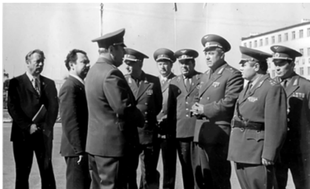
Руководящий состав сборов