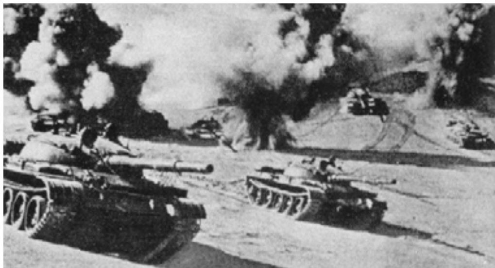
Танкисты-уральцы на учениях