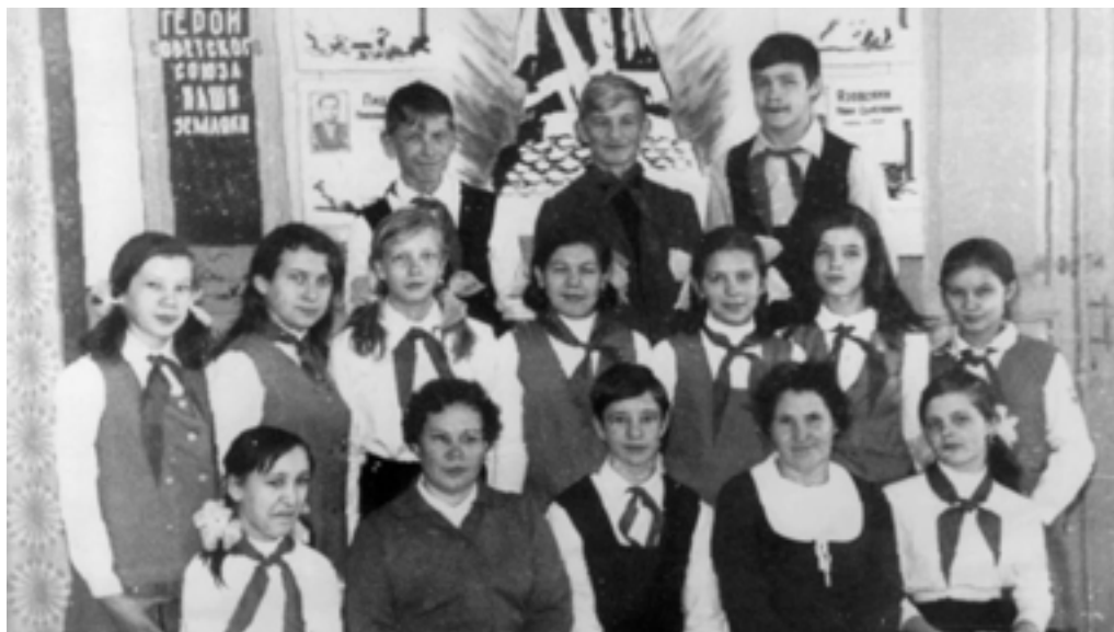
«Красные следопыты» из Далматова со своими наставниками.

В 1977 году, в преддверии 60-летия Советской Армии и Военно-Морского Флота Военный совет Краснознаменного Уральского военного округа за большую военно-патриотическую работу наградил Курганскую городскую комсомольскую организацию переходящим Красным Знаменем.