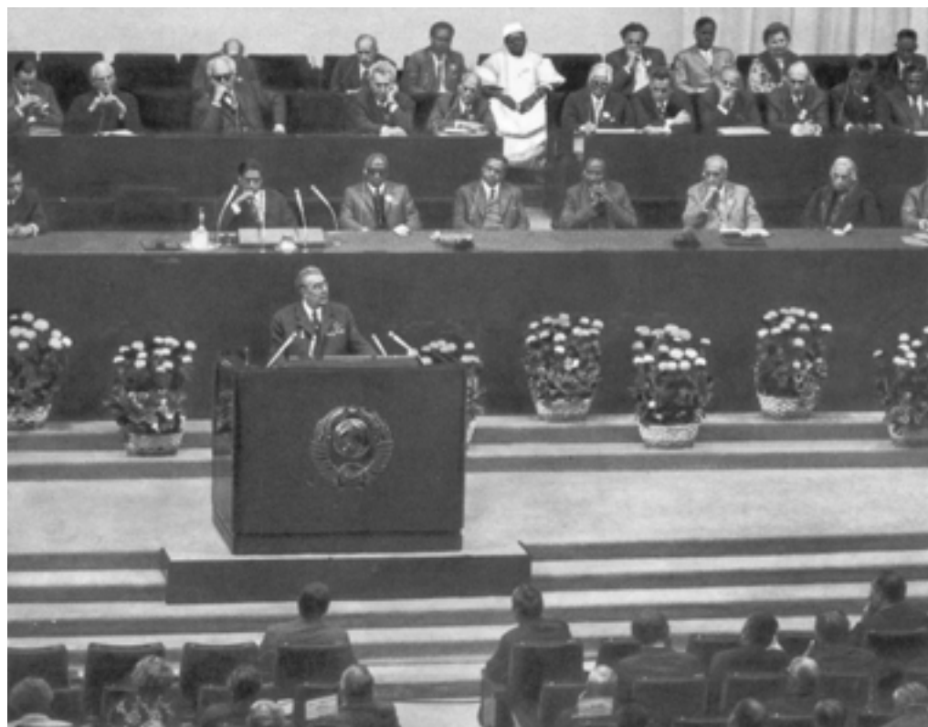
Всемирный конгресс миролюбивых сил. Москва, 1973 год

Во второй половине 70-х годов был осуществлен дальнейший поворот к разрядке международной напряженности. Но СССР и США по разному относились к